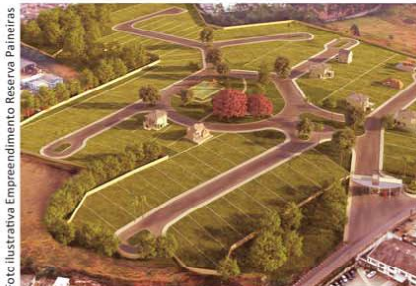
Empreendimento Reserva Palmeiras