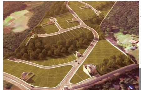
Foto: Ilustrativa Empreendimento Reserva dos Pires

mais informações acesse: www.apicesec.com.br